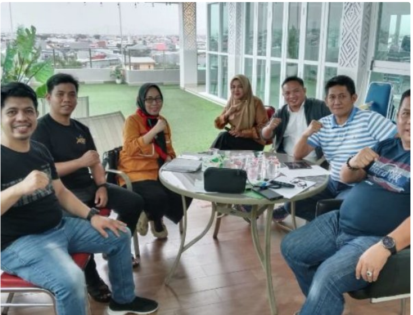
FORKODA PP-DOB Sulsel Jadwalkan Pelantikan dan Raker 18 Januari di Hotel Claro Makassar

MAKASSAR — Forum Komunikasi Daerah (FORKODA) Percepatan Pembentukan Daerah Otonom Baru (PP-DOB) Provinsi Sulawesi Selatan dijadwalkan menggelar pelantikan dan rapat kerja (raker) pengurus pada Minggu, 18 Januari 2026 mendatang.